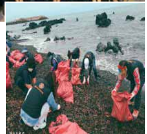
▶石の海岸で有名なネド洞アルジャクチのクリーン活動

姉妹地区締結以来、地区大会での相互訪問、カンボジアでの合同奉仕事業、財団補助金事業となった伊勢原平成RCが済州西部RCと共同で、伊勢原市の選抜中学生と済州の中学生との相互訪問国際交流研修会を行うなど年々親睦と交流の輪が広がっています。