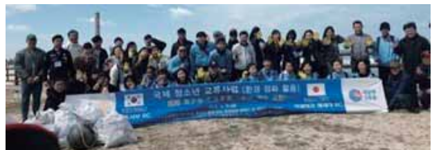
中学生共同海岸クリーンキャンペーンの様子

姉妹地区締結以来、地区大会での相互訪問、カンボジアでの合同奉仕事業、財団補助金事業となった伊勢原平成RCが済州西部RCと共同で、伊勢原市の選抜中学生と済州の中学生との相互訪問国際交流研修会を行うなど年々親睦と交流の輪が広がっています。