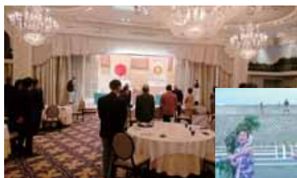
ゲストを招いて屋外での交流例会

初秋には屋外のスペースを使ってゲストの方達との交流例会も行い、2月には30周年記念事業の一環として平塚市への寄付を行いました。また5月には30周年記念例会（式典）を開催する予定となっております。