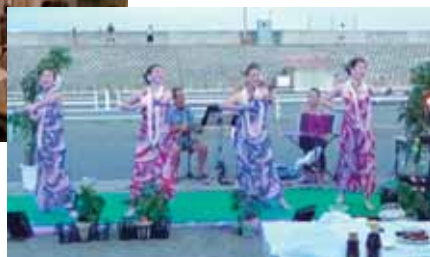
会場を広くして例会を再開