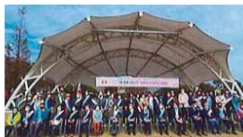
キムチ分け合い奉仕 (濟州ハンマウムRC) 濟州大学病院に後援金寄贈 (濟州ソムタリRC) 新しい命を分かち合う臓器寄贈キャンペーン (濟州ミダムRC)