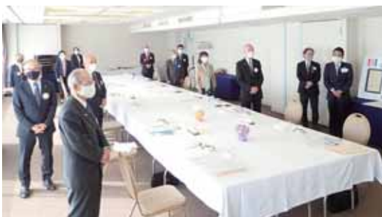
ガバナー公式訪問