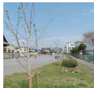
50周年記念 植樹の桜