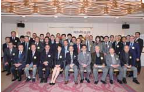
久保田ガバナーを囲んで記念撮影