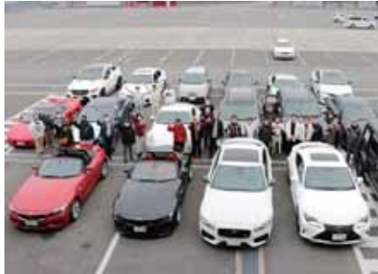
企業訪問 富士スピードウェイ