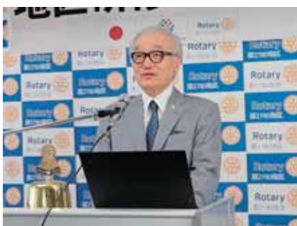
田島ガバナーエレクト