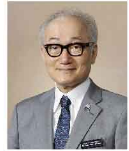
国際ロータリー第2780地区 2021～22年度ガバナー