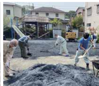
60周年記念事業中里公園整備