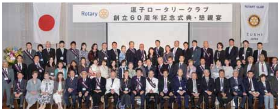
創立60周年記念式典 姉妹クラブ京都紫野RCと共に

本年度は、引き続き「えのすいと考える逗子の海と生き物セミナー2」を開催しました。コロナ感染拡大により参加者は350人と制限したため、動画配信を行い、多くの反響を得ることが出来ました。逗子開成高校などのインターアクトや海外の高校生も一緒に活動しており、地元の研究者や環境保護活動の団体と繋がることが増えてきました。大きなテーマですので、他クラブとも協力して発展できればと考えております。どうぞ、よろしくお願い致します。