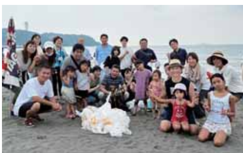
ビーチクリーン家族移動例会