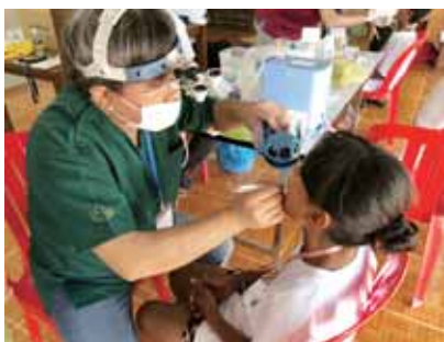
カンボジア医療奉仕