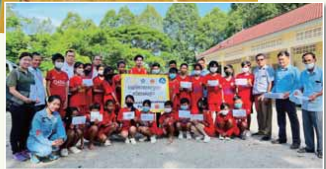
第3グループ ローターリー奉仕デー『カンボジア まごころお届けプロジェクト』(2022年3月実施)

IMAGINE ROTARY IMAGINE ROTARY IMAGINE ROTARY IMAGINE ROTARY IMAGINE ROTARY IMAGINE ROTARY