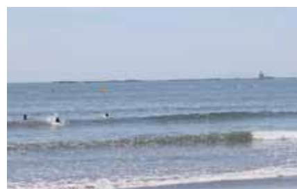
45th記念事業 青少年サーフィンコンテスト