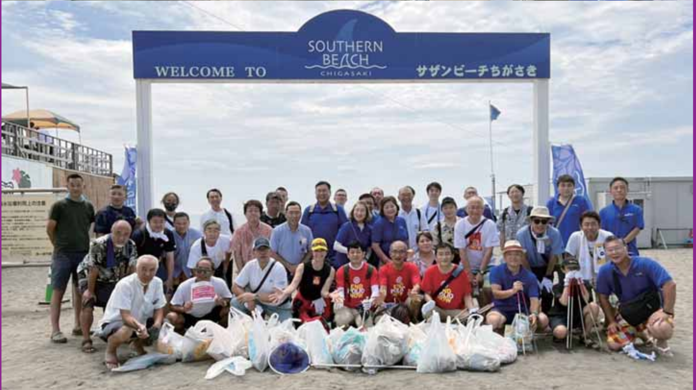
▲茅ヶ崎RCによる海岸清掃 (2022年7月18日実施)

毎年海の日には茅ヶ崎の伝統行事「浜降祭」のあとで行われている。コロナ禍で祭は3年連続の中止となったが、今年も茅ヶ崎湘南RCや友好クラブの東京世田谷RCと共に、賑やかに楽しく行われた。