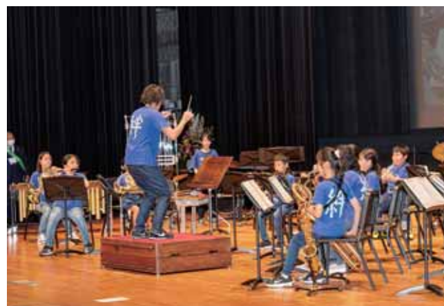
アトラクション 相模原市立共和小学校 吹奏楽団