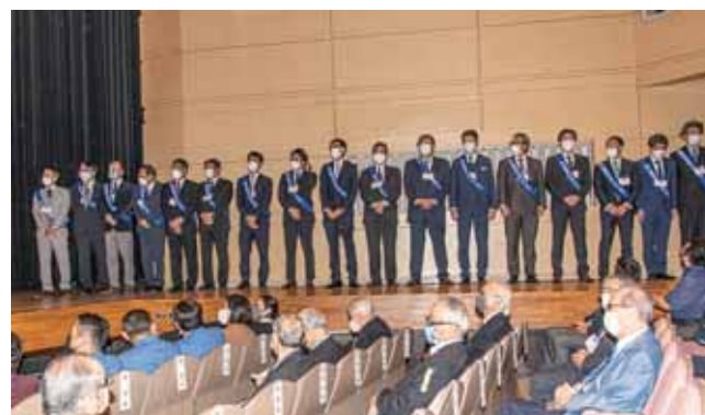
新クラブ紹介 相模原おださがロータリークラブ