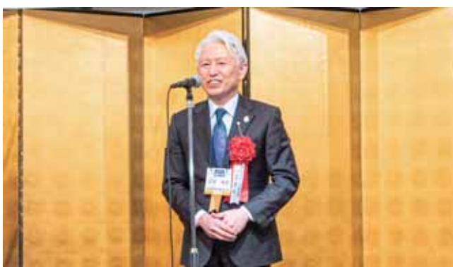
四宮孝郎 RI会長代理