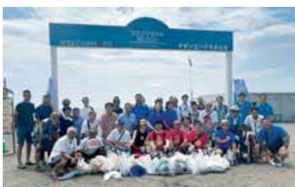
RC合同ビーチクリーン