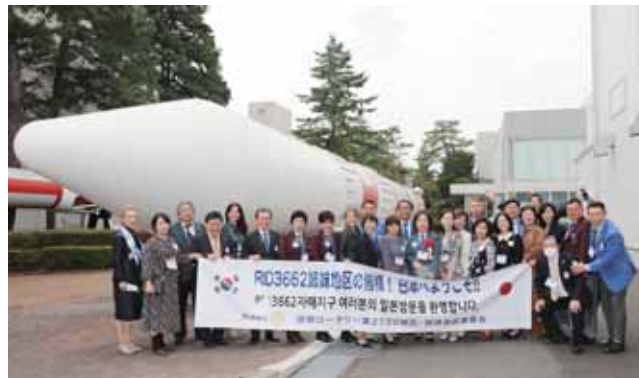
エクスカーション JAXA相模原キャンパス