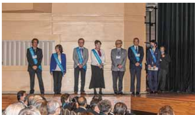
新クラブ紹介 かながわDEIロータリークラブ