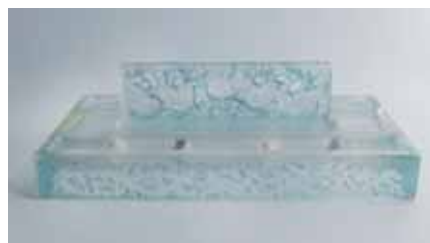
アール・デコ調ガラス製インク壺 ルネ・ラリック、1920年頃、仏/ナンシーにて製作