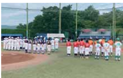
学童部交流野球大会