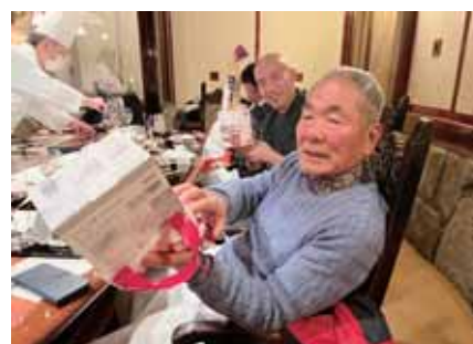
クリスマス親睦例会