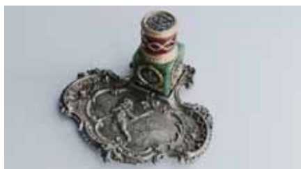
エカチェリーナ2世時代風孔雀石製インク壺 18世紀末、露/サンクト・ペテルブルクにて製作