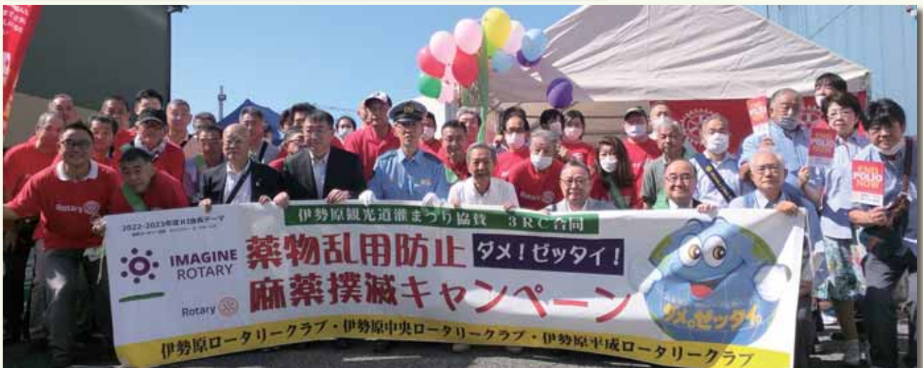
伊勢原道灌祭り 市内3RC合同 薬物乱用防止・キャンペーン

IMAGINE ROTARY IMAGINE ROTARY IMAGINE ROTARY IMAGINE ROTARY IMAGINE ROTARY IMAGINE ROTARY