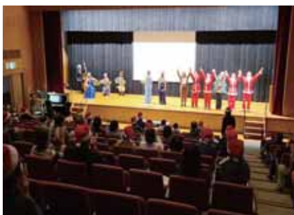
手をつなぐ育成会クリスマス会