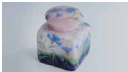
アールヌーボー調ガラス製インク壺 ドーム兄弟、1910年頃、仏/ナンシーにて製作