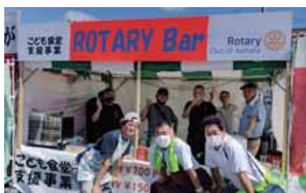
道灌まつり模擬店