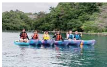
シーカヤック体験