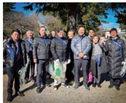
メンバーと共に小田原城清掃活動