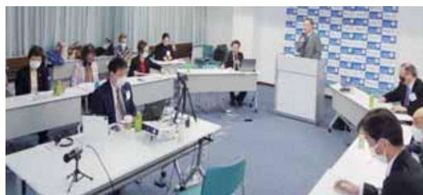
2780地区 Zoom 女性交流会会場