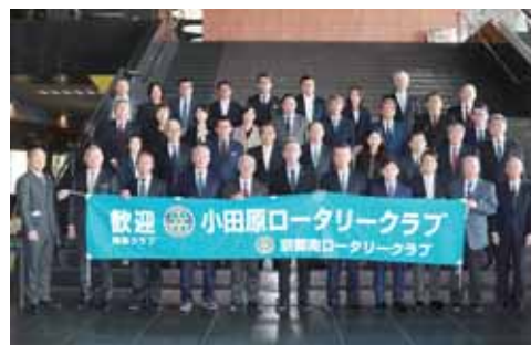
姉妹クラブ 京都南RC