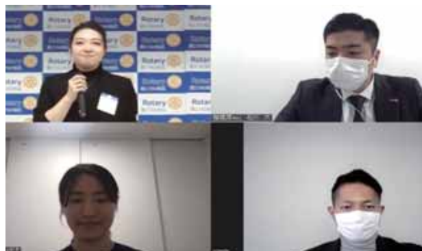
相模原ローターアクトクラブの皆様