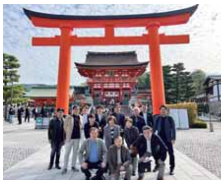
家族親睦旅行で京都へ(伏見稲荷神社)