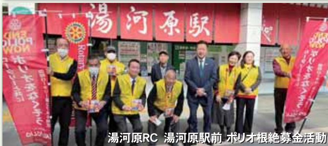
湯河原RC 湯河原駅前 ポリオ根絶募金活動