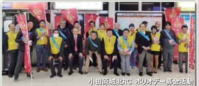
小田原城北RC ポリオデー募金活動