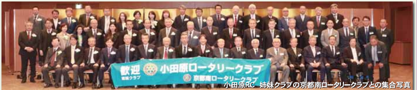
小田原RC 姉妹クラブの京都南ロータリークラブとの集合写真

IMAGINE ROTARY IMAGINE ROTARY IMAGINE ROTARY IMAGINE ROTARY IMAGINE ROTARY IMAGINE ROTARY