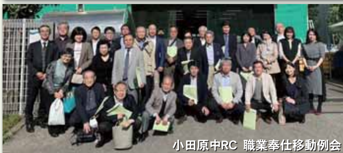
小田原中RC 職業奉仕移動例会