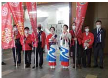
ポリオ募金活動 箱根湯本駅

また、今年2月には箱根中学校の3年生49名をお招きして「テーブルマナー教室」を開催。この取り組みは当クラブの恒例行事でありましたが、コロナ禍の影響で4年振りの開催となりました。当日は会員も生徒と同じテーブルにつき、講師の解説とアドバイスを受けながら和気あいあいとフルコースを楽しみました。新世代奉仕活動の一環としてこれからも継続して参りたいと思います。