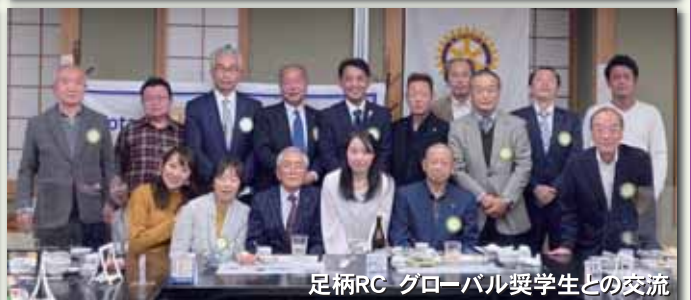
足柄RC グローバル奨学生との交流

IMAGINE ROTARY IMAGINE ROTARY IMAGINE ROTARY IMAGINE ROTARY IMAGINE ROTARY IMAGINE ROTARY