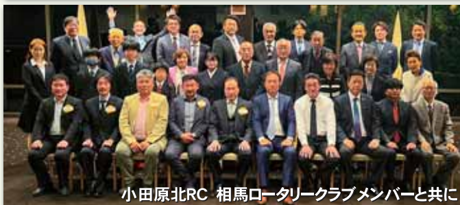
小田原北RC 相馬ロータリークラブメンバーと共に