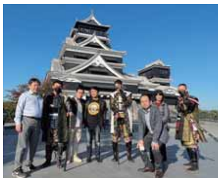
肥後大津ロータリークラブへ(熊本城)