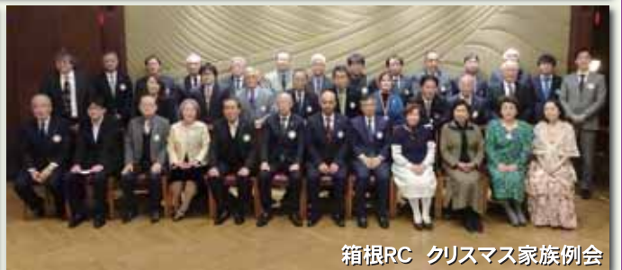
箱根RC クリスマス家族例会