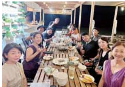
クラブ会員が運営する 海の家での移動例会