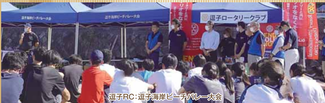
逗子RC:逗子海岸ビーチバレー大会