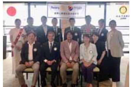
2023～2024新年度初回の例会