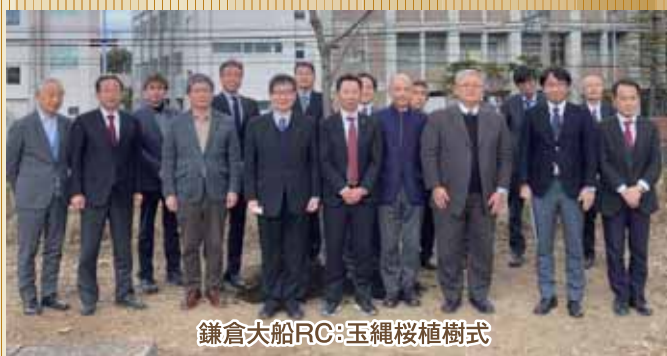
鎌倉大船RC:玉縄桜植樹式