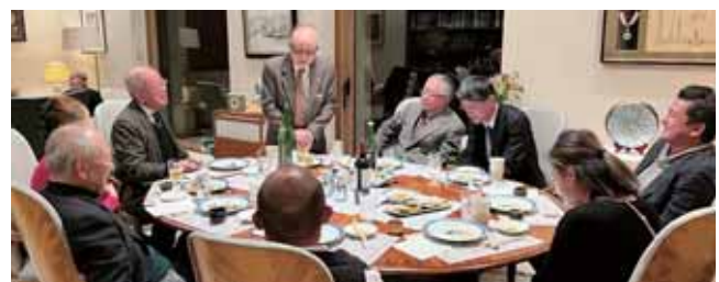
新会員研修炉辺会合