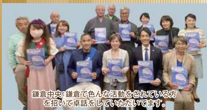
鎌倉中央:鎌倉で色々な活動をされている方 を招いて卓話をしていただいています。