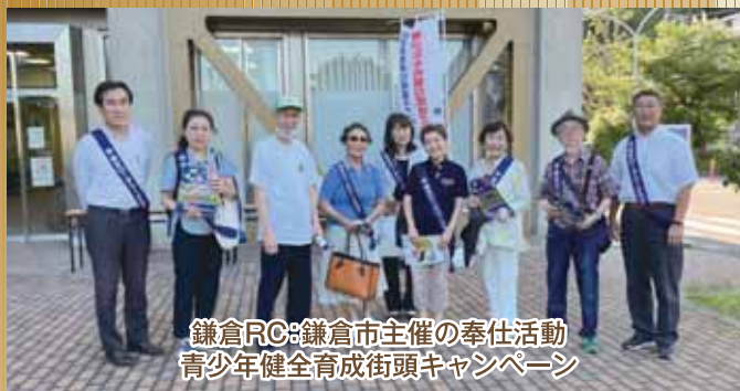
鎌倉RC:鎌倉市主催の奉仕活動 青少年健全育成街頭キャンペーン