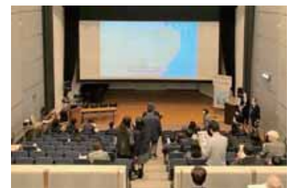
湘南青少年環境会議 in 逗子2023

また、若者と希望を共有すべく、地域と協力して環境問題にも取り組んでおります。昨年度に開催した「湘南青少年環境会議in逗子2023」では、中高生が、環境省職員、県教育委員会、神奈川県ユニセフ協会職員と意見交換をし、大変、有意義な会議となりました。本年度は、さらに充実させて開催する予定です。20回を超える逗子海岸ビーチバレー大会では、海岸の保全を訴えながら、美しいビーチを楽しむイベントで、逗子開成インターアクトクラブにもお手伝いを頂き、毎年200名の参加者を迎えています。