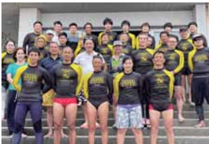
葉山ライフセービングクラブに 葉山RCのロゴ入りユニフォームを協賛

職業奉仕だけでも世界に希望を生み出せる会員達があります。奉仕活動は葉山ライフセービングクラブを支援しています。又、地元の中学校で葉山町消防本部や葉山町教育委員会に協力していただき心肺蘇生を開催します。そして、来年は葉山100周年に向けて葉山町の子どもたちに希望を与える作文コンクールを葉山町と当クラブがコラボの催しを計画中です。ワクワク楽しい葉山ロータリークラブにぜひメンバーシップしてください。