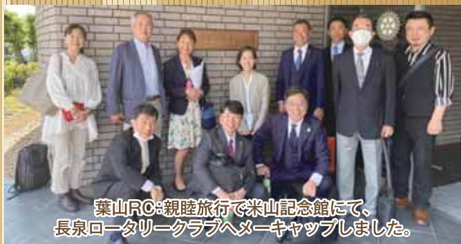
葉山RC:親睦旅行で米山記念館にて、 長泉ロータリークラブへメーキャップしました。